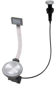
VIDAGE FADE PUSH INOX A407 A16